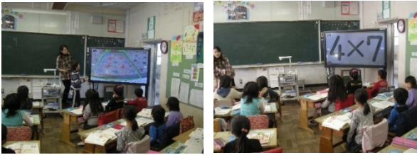
中部小 ICT 授業を見学 楽しそう