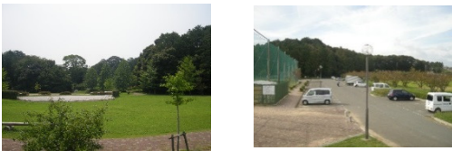
うさぎ山を青少年のメッカに、運動場にナイター設備を