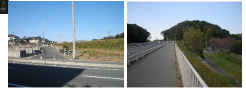
市民から当局への要望 悲喜こもごも