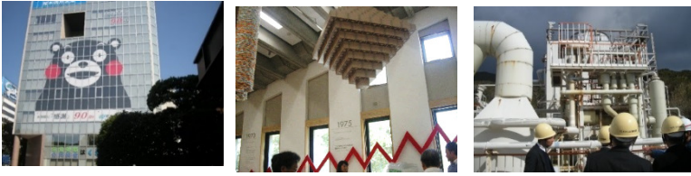
熊本 シティプロモーション 鹿児島 環境未来館 八丈島 全島電力自給自足