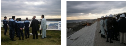
福田港 サンドパイパス 竜洋 防潮堤整備事業