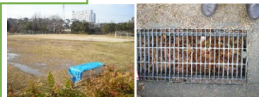
安久路公園グラウンド駐車場整備 GGクラブ要望成る！