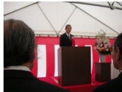
こうのとり東保育園 移転起工式