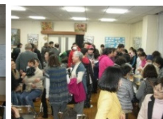
多文化交流センター「こんにちは」10周年