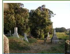
三ヶ野 谷間埋立地 発展の可能性は？