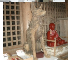
11月駒ヶ根市と交流 “チガイ”鮮明