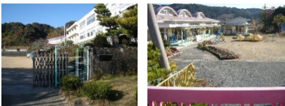
豊岡東小・東幼稚園統合問題終結