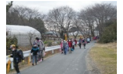
田原小通学路 時間規制不可