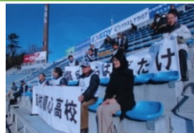
全国高校女子サッカー 最後の応援