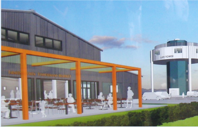
イメージ図(仮称)交流館から津波避難タワー方面

6月28日(日)、磐田市豊浜福田漁港内に建設される“食の拠点づくり施設整備事業”建設工事の安全祈願祭が行われました。6958.54㎡の敷地の中に、津波避難タワーと(仮称)交流館が建設されます。