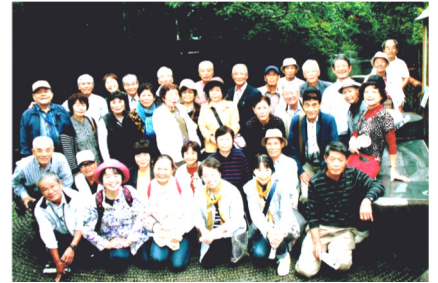
三島 源兵衛川散策 平成27年10月5日