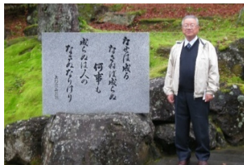
宿泊した米沢市の上杉神社にて、上杉鷹山碑「なせば成る なさねばならぬ何事も 成らぬは人の なさぬなりけり」

平成26年度全建賞、平成27年度木材利用優良施設林野庁長官賞を受賞した木の香いっぱい南陽市文化会館を視察してまいりました。「市内の森林資源で文化会館を創る」をコンセプトに南陽市産材を主に木造、木質にこだわって創られました。総事業費66.5億円（内、補助金32.9億円）。延床面積5,900㎡。