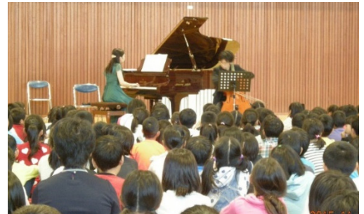
世界に1台しかない特別仕様ピアノの 価格はなんと3,000万円