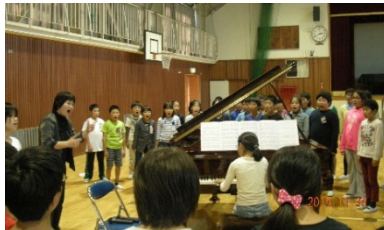
サプライズ! コンサート終了後このピアノで合唱練習

河合楽器製作所が磐周校長会と協賛して行っている「学校コンサート」が3年目を迎え、磐田北小、中部小、西小の3校で行われました。この度は議長のご理解も受け、議員の皆様にも見て聴いていただきました。コンサートのおまけとしてこの特別仕様のピアノを弾くことができたラッキーな生徒もいました。