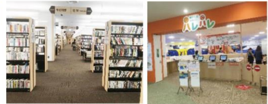
ビルの4～6階は図書館、子ども広場等子育て拠点となっている

平成17年ダイエー明石店は撤退し、中心市街地は衰退してしまつたところを、賑わいを求め平成20年から駅前再開発事業の検討が始まり、駅南の一角に駅前再開発ビル「パピオスあかし」が平成29年3月に完成して市は賑わいを取り戻したのであります。