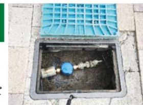
この機会に我が家の水道管を20→13m/m口径に変更いたしました