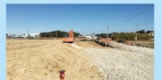
新駅と同時完成を目指す 大立野福田幹線