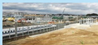
着々と進むJR磐田新駅工事